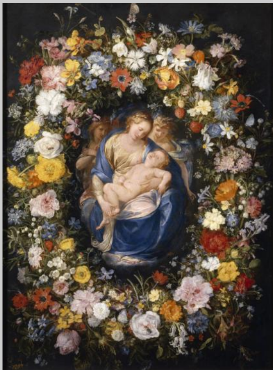
Brueghel l'Ancien et Giulio Cesare Procaccini, Guirlande avec la Vierge, l'Enfant et deux anges , autour de 1619